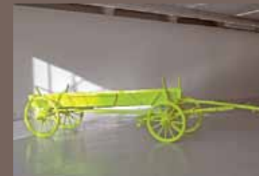
Anselm Reyle Neonlackierung