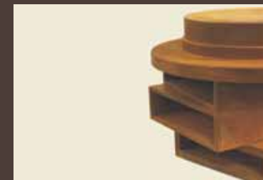
Thomas Scheibitz Grill 2009, (Detail) PS Metall Stahl