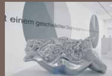
Veronika Witte Chrom-Optik-Beschichtung