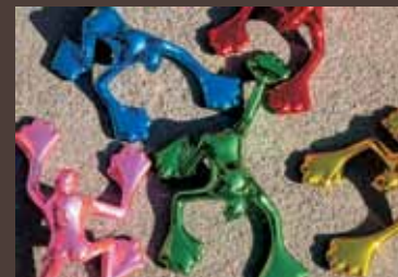
atelier rosalie Flossis, Chrom-Optik, farbig lasiert