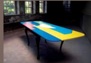
Alessandro Mendini Tischobjekt, mehrfarbig