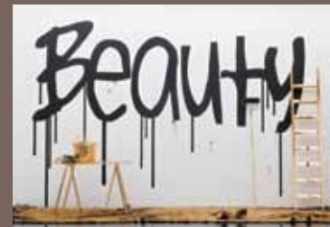
Eckart Hahn Chrom-Optik-Beschichtung, Gold