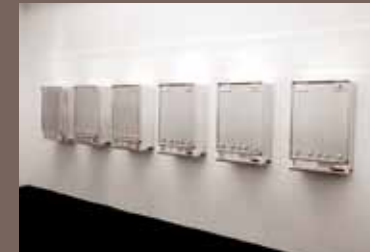
Michael Sailstorfer Chrom-Optik-Beschichtung