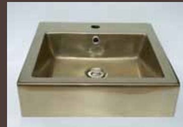
Waschbecken Keramik, Messing-Beschichtung, poliert