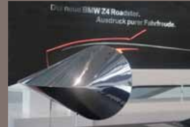
Oloid, BMW-Welt Kunstholz, Chrom-Optik-Beschichtung