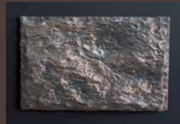
Kunststein Bronze-Beschichtung, schwarz patiniert