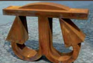
Skulptur - Thomas Scheibitz MDF, Metall-Beschichtung, Rost Patina