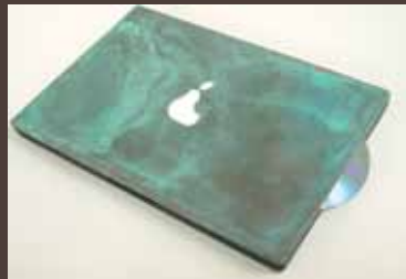
Notebook Kupfer-Beschichtung, grün patiniert