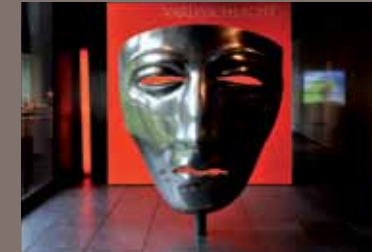
Varusmaske, Museum Kalkriese GFK, Aluminium-Beschichtung, poliert