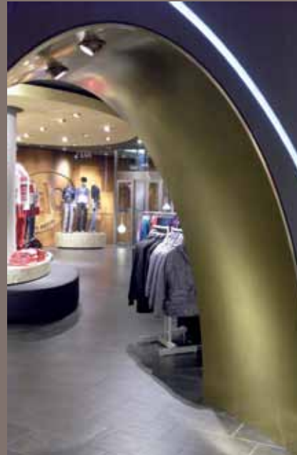
ESPRIT-Shop, Jonas Ladenbau Torbogen aus MDF, Messing-Beschichtung, poliert