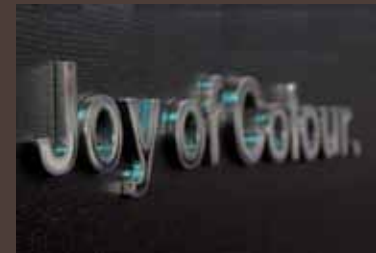
„Joy of Colour“, Ladenbau Acrylglas, Chrom-Optik-Beschichtung