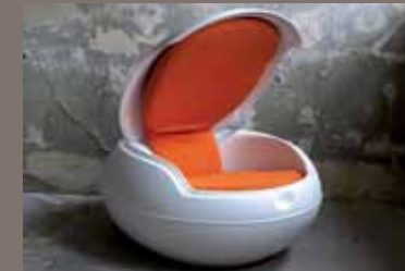
Designklassiker „Egg Chair“ GFK, Soft-Touch-Beschichtung, weiß