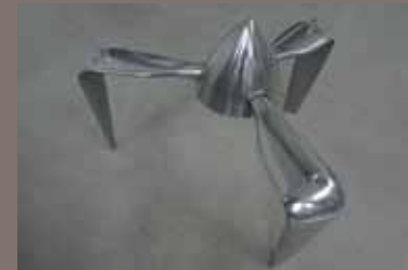
Tischobjekt „Propeller“, Dula-Werke GFK, Aluminium-Beschichtung, poliert